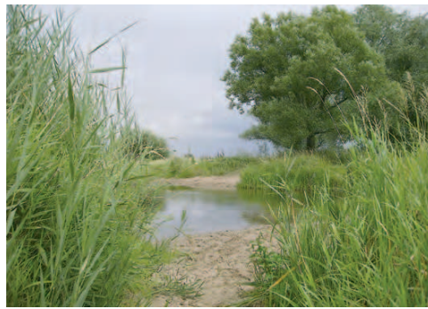
Furt durch die Ehle

Vom Willy-Brandt-Platz aus fahren Sie durch die Innenstadt entlang der Ernst-Reuter-Allee und über die drei Elbbrücken in den Ostteil der Stadt. An der Fußgängerampel „Am Cracauer Tor“ halten Sie sich rechts um nach weiteren 100 m linker Hand auf dem Biederitzer Radweg stadtauswärts zu radeln. Fast von allein rollen Sie auf dem komfortabel ausgebauten Radweg, vorbei an der Bördelandhalle und dem neuen Fußballstadion bis zur Straße „Ehlegrund“, in die Sie einbiegen. Die Stadt haben Sie jetzt hinter sich gelassen und tauchen ein in ländliche Idylle zwischen Deich,