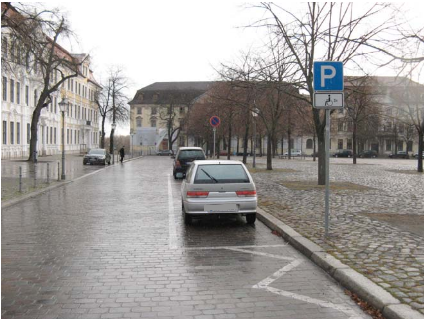
Nordfahrbahn mit geschnittenem Großpflaster vor dem Landtag

mit dem übrigen Straßennetz verbunden. Die Fahrbahnbreiten liegen bei 6,00 bis 7,00m und sind mit Reihengroßpflaster, eingefasst von Granitborden, befestigt. In der Nordfahrbahn einschließlich Gouvernementsberg wurde die Fahrbahn mit geschnittenem Reihengroßpflaster in gebundener Bauweise neu verlegt.