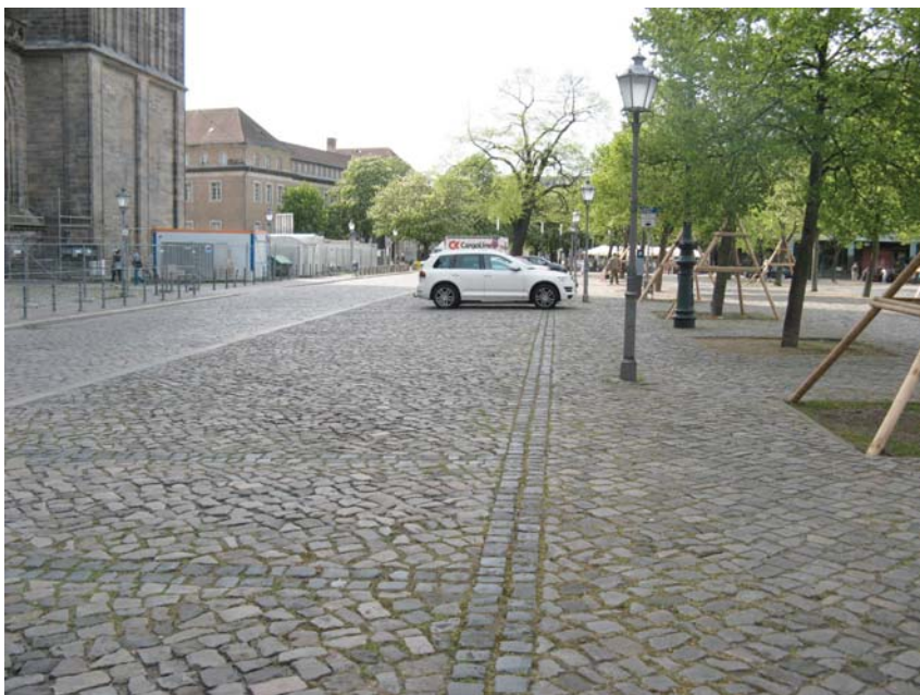
Senkrechtparkstände an der Südseite des Domplatzes

Die Parkstände werden mit Polygonalpflaster befestigt und die Parkstandbreite mit Blaubasaltkleinpflaster gekennzeichnet.