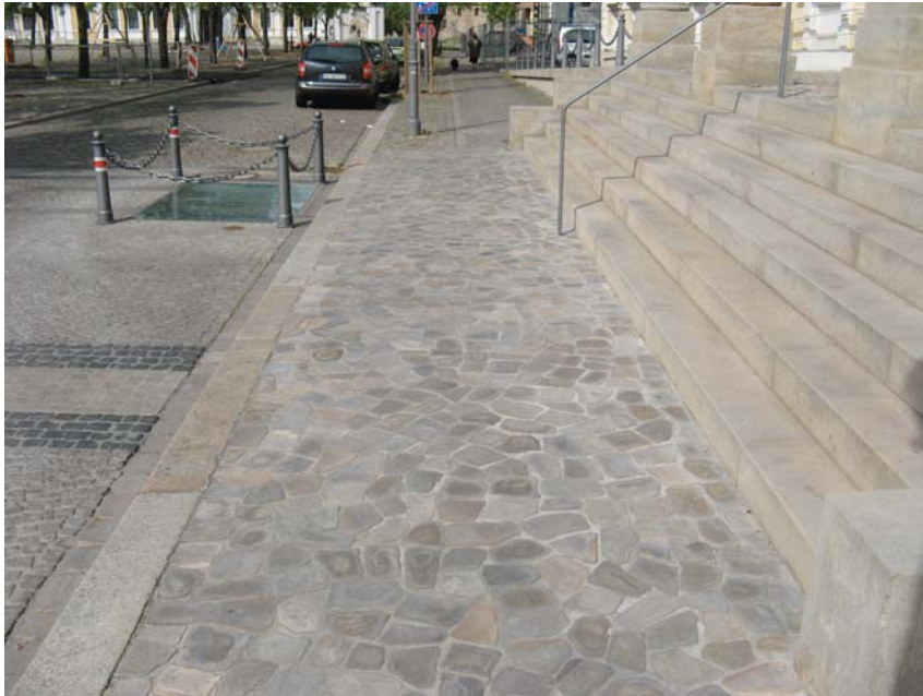
Geschnittenes Polygonalpflaster an der Ostseite des Domplatzes

Die Behindertenstellplätze in der Platzinnenseite einschl. des Ausstiegsbereiches sollten mit geschnittenem Polygonalpflaster befestigt werden.