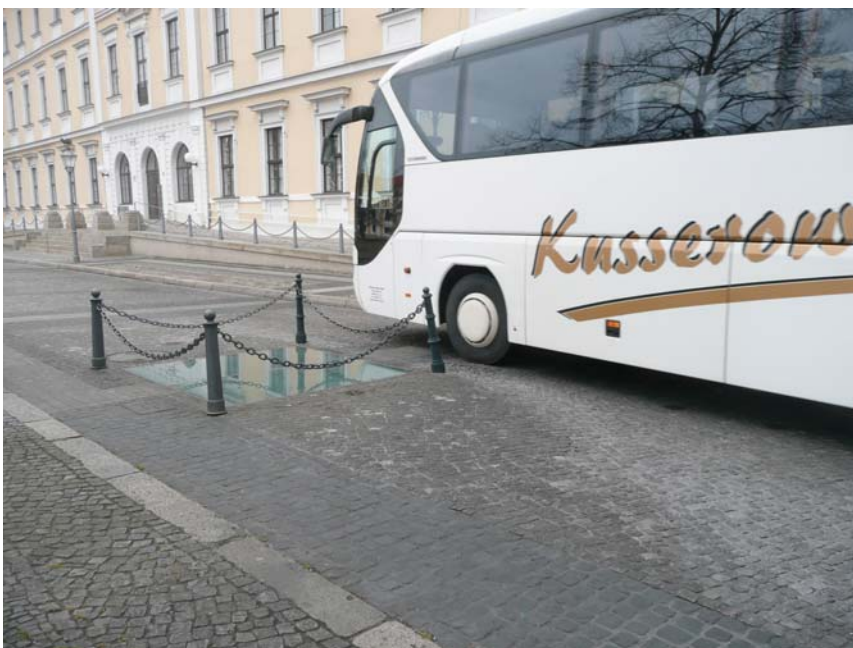
Fahrbahneinengungen in der Ostfahrbahn an den Sichtfenstern zu den Fürstengräbern

Die Gehwegbereiche an der Nord-, Süd- und Westseite des Domplatzes sind in einem relativ guten Zustand. Der Gehweg an der Ostseite ist teilweise sehr holprig und mit Rollstuhl oder Rollator schlecht befahrbar.