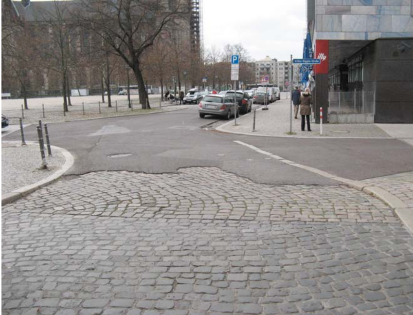
Fahrbahnzustand der Westfahrbahn an der Einmündung der Arthur-Ruppin-Straße

Die Westfahrbahn ist teilweise bituminös überbaut und weist insgesamt starke Versackungen und Verdrückungen auf.