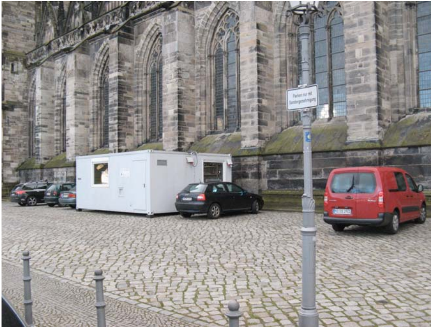
Private Stellplätze der evangelischen Domgemeinde u. der Stiftung Dome u. Schlösser

Für den Lieferverkehr sind an der Westseite vor dem Gebäude der Nord LB je ein Bereich für Krankenfahrzeuge und Lieferfahrzeuge vom übrigen Ruhenden Verkehr freigehalten. In den übrigen Bereichen des Domplatzes bestehen keine besonderen Probleme für den Lieferverkehr.