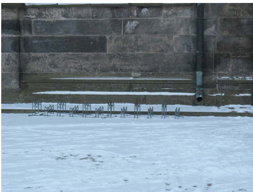
12 Fahrradstellplätze am Domeingang