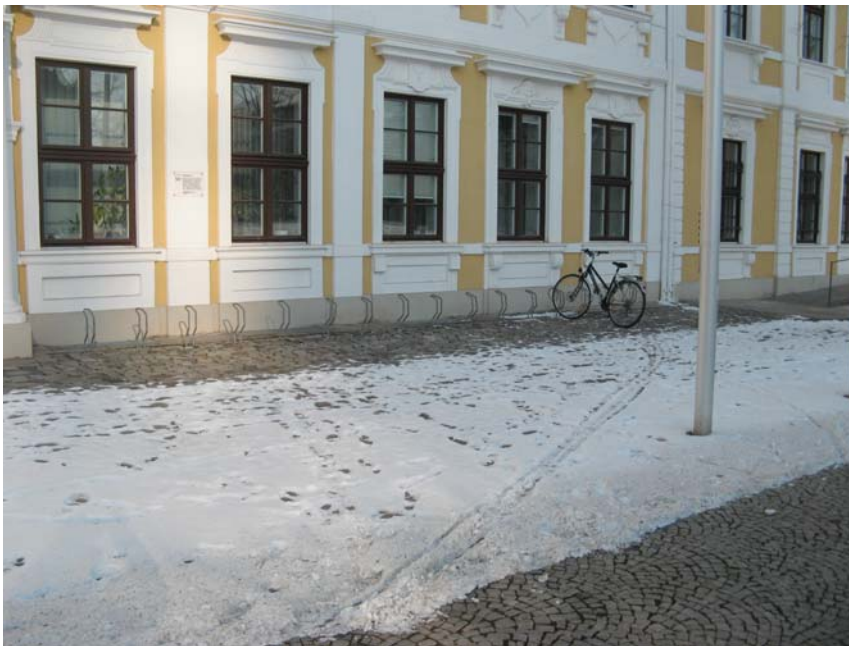
16 Fahrradstellplätze am Landtag