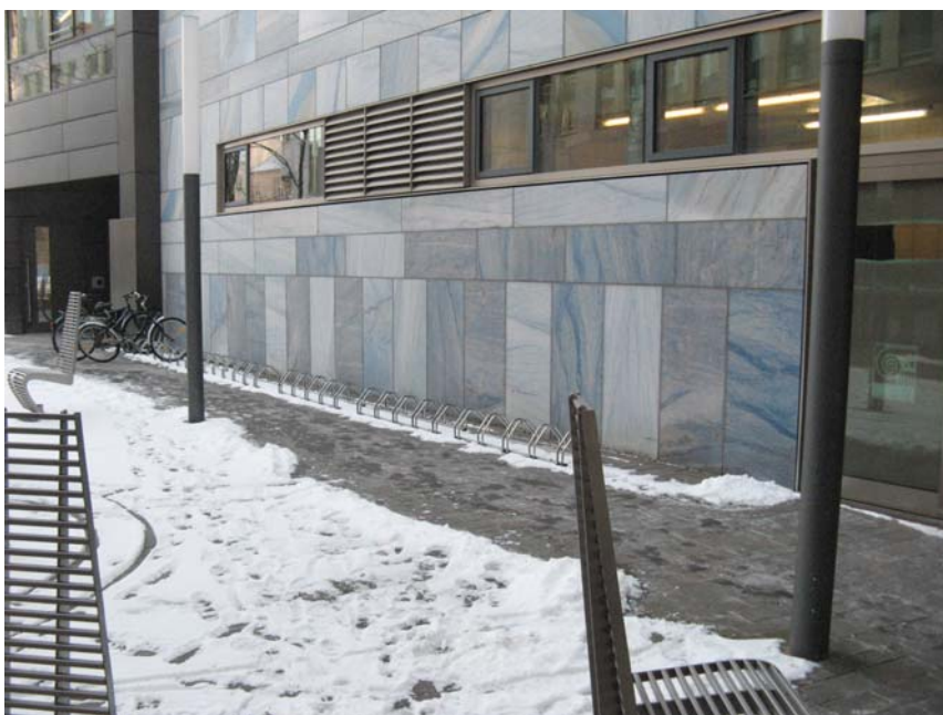
Fahrradstellplätze am Gebäudekomplex der Nord LB