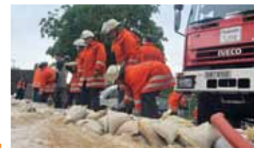
Schutzwälle aus Sandsäcken