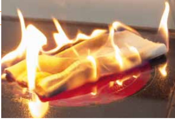
Eine der häufigsten Ursachen für Feuer in der Küche: Ein Handtuch, das auf einer eingeschalteten Herdplatte liegt