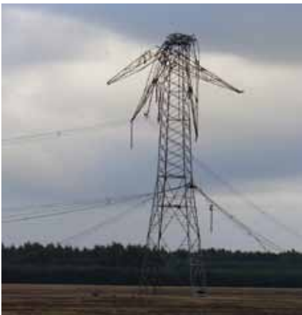
Sturmschaden durch den Orkan Kyrill im Jahr 2007