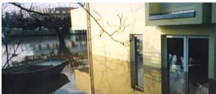
Hochwasser in Königswinter am Rhein