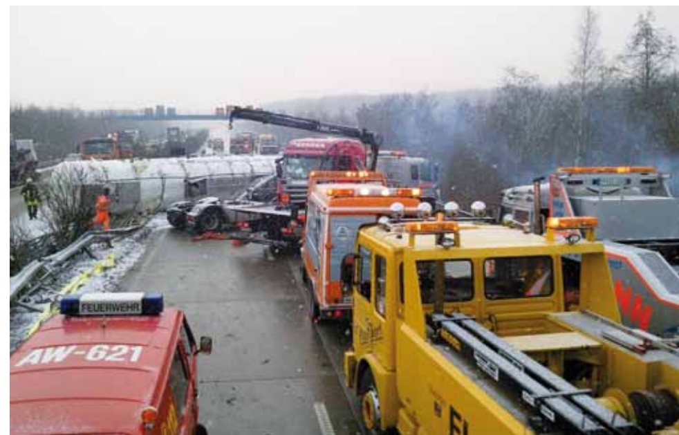
Schwerer Unfall eines Gefahrgut-LKW