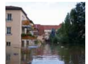
Hochwasser in der Stadt