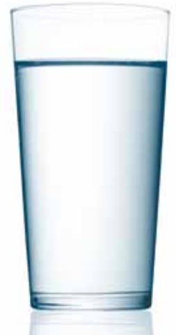
Der Mensch kann nur 4 Tage ohne Flüssigkeit auskommen