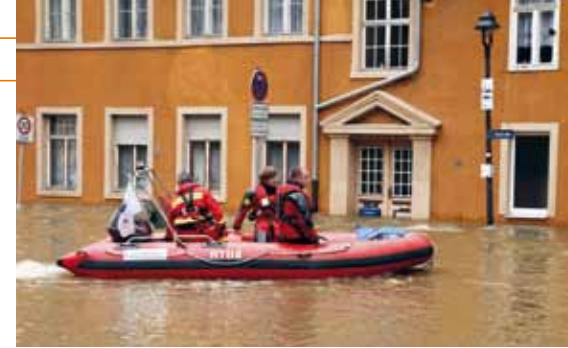
Rettungshelfer beim Hochwasser in Halle, Sachsen-Anhalt, 2013