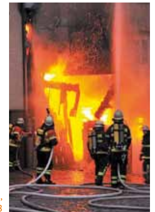
Hausbrand in Monschau, Nordrhein-Westfalen 2008