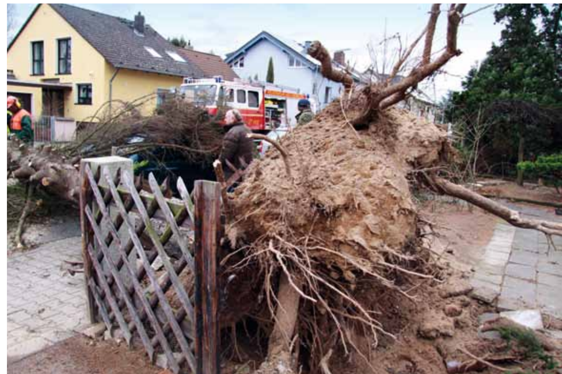
Sturmtief Xynthia sorgte in Hessen für gefährliche Orkanböen, 2010