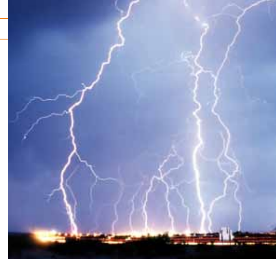
Blitzeinschlag in der Großstadt