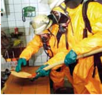
Feuerwehrleute während einer Simulation eines Laborunfalls im Landeskriminalamt Mainz, Rheinland-Pfalz, 2003