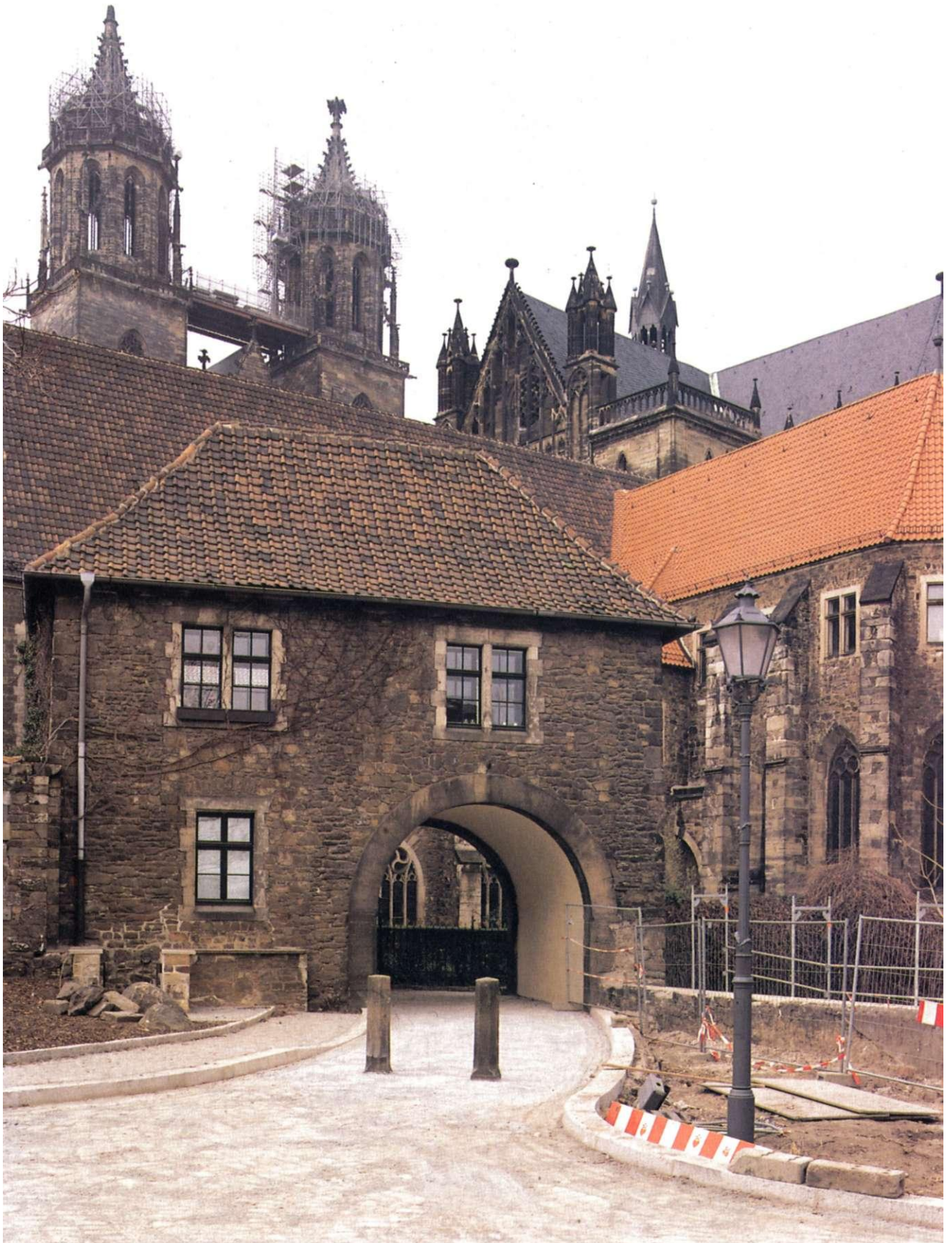
Neugestaltung des Domumfeldes 1998, Zugang zum Remtergang