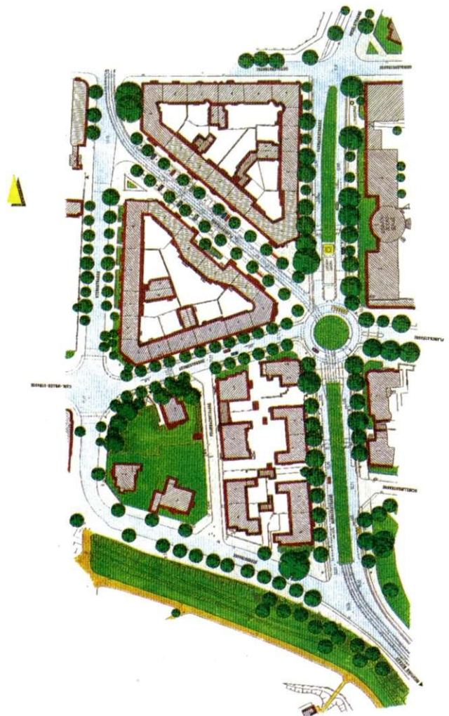
Freiraumplanerisches Konzept der Strassenräume Harnackstrasse, Seumestrasse und Planckstrasse

Die Seumestraße wird, wie in der Verkehrskonzeption Innenstadt beschlossen, eine Durchgangsstraße für den Verkehr, der vom Magdeburger Ring zum Schieffufer geleitet wird. Durch diese Maßnahme muß die Straße zukünftig mehr Verkehr aufnehmen als es heute der Fall ist. Diesem Umstand wurde mit der Planung Rechnung getragen. Grundsätzlich wurden die bestehenden Gegebenheiten beibehalten und um historische und moderne Elemente ergänzt. So wurde die Baumreihe als Gestaltungselement in die Planung aufgenommen, aber versetzt von ihrem alten Standort in die Planung integriert. Die Hochborde werden neu ersetzt und in ihrer Lage den fahrtechnischen Gegebenheiten angepaßt.