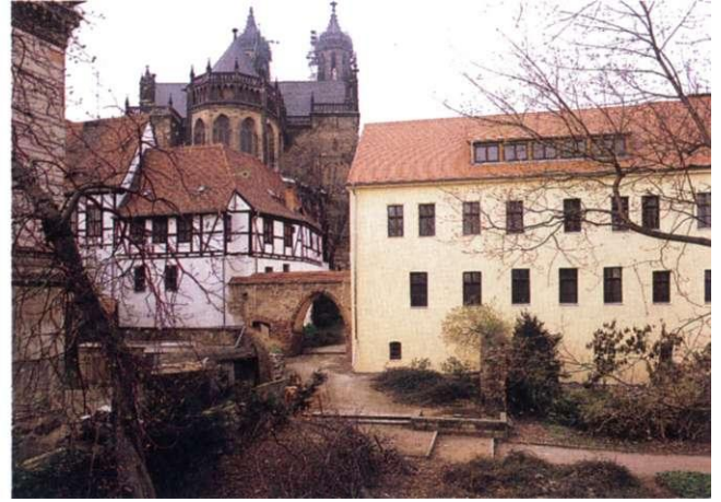
Möllenvogtei mit dem gotischen Stadttor während der Restaurierungsarbeiten 1998