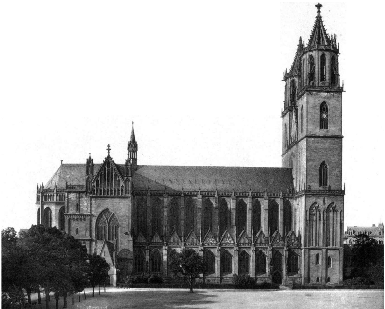
Domplatz und Dom von Norden nach einer Aufnahme von E. von Flottwell (1891)

kommenden Jahre bis 2001 ist die Gestaltung des Domplatzes im Bereich der ehemaligen Kaiserpfalz. Die Planungen hierzu werden in diesem Jahr beginnen. Gegenwärtig befinden sich auch die Bereiche des Fürstenwalls und des Möllenvogteigartens in der Planung. Ziel ist die bessere touristische Erschließung beider Freianlagen. Die Untersuchung der Stadtmauern hat die Notwendigkeit umfangreicher Sicherungs- und Sanierungsarbeiten an diesen Bauwerken ergeben, die zur Zeit vorbereitet werden. Der vorhandene Baumbestand mußte auf dem Fürstenwall zum größten Teil entfernt werden, um eine nachhaltige Sicherung und Neugestaltung der Anlage zu erreichen.