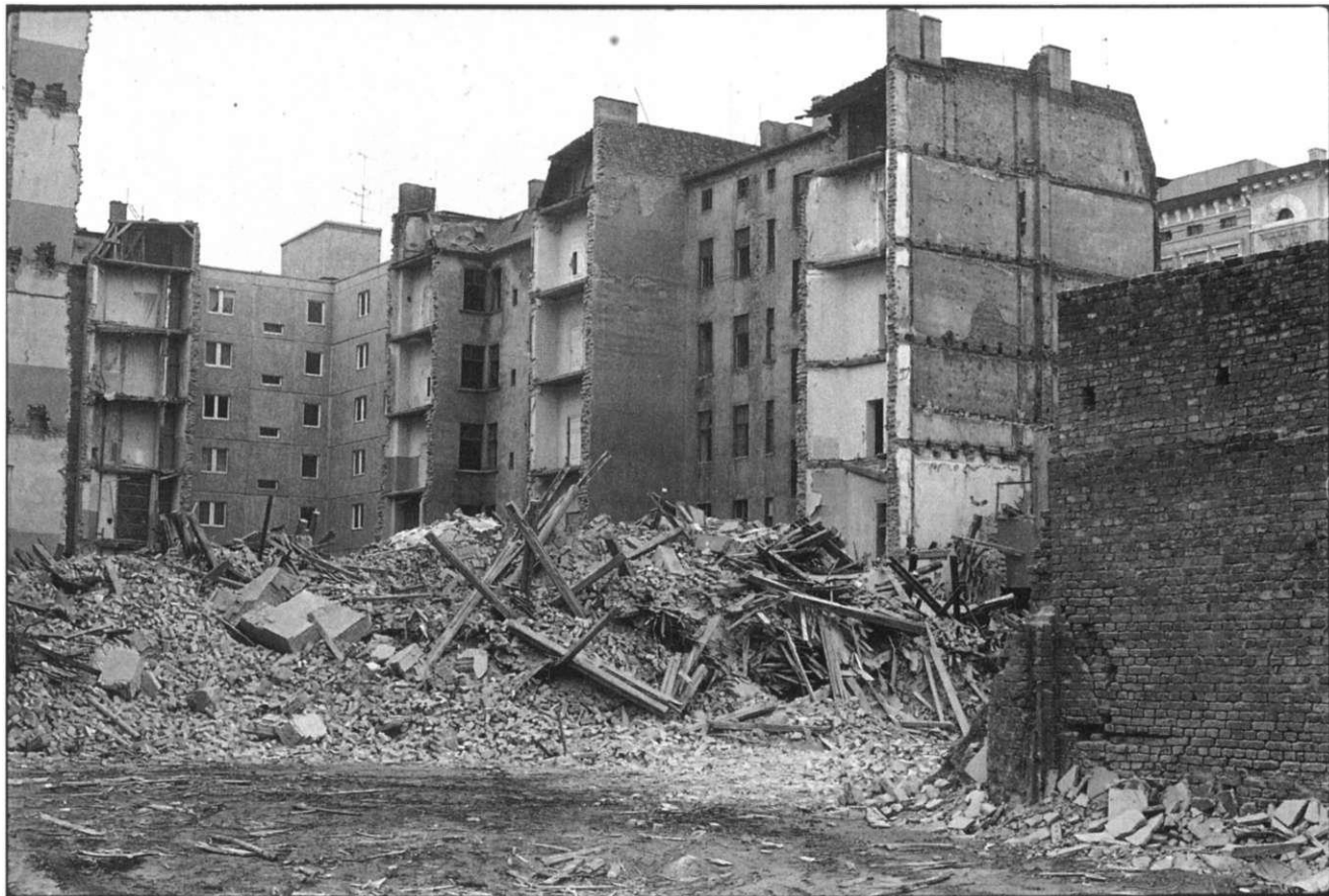
Entkernung der Quartiere und Lückenschliessung mit Plattenbauten in der 2. Hälfte der 80er Jahre Unbefriedigender Zustand in den Innenhöfen nach Sanierung der Bausubstanz