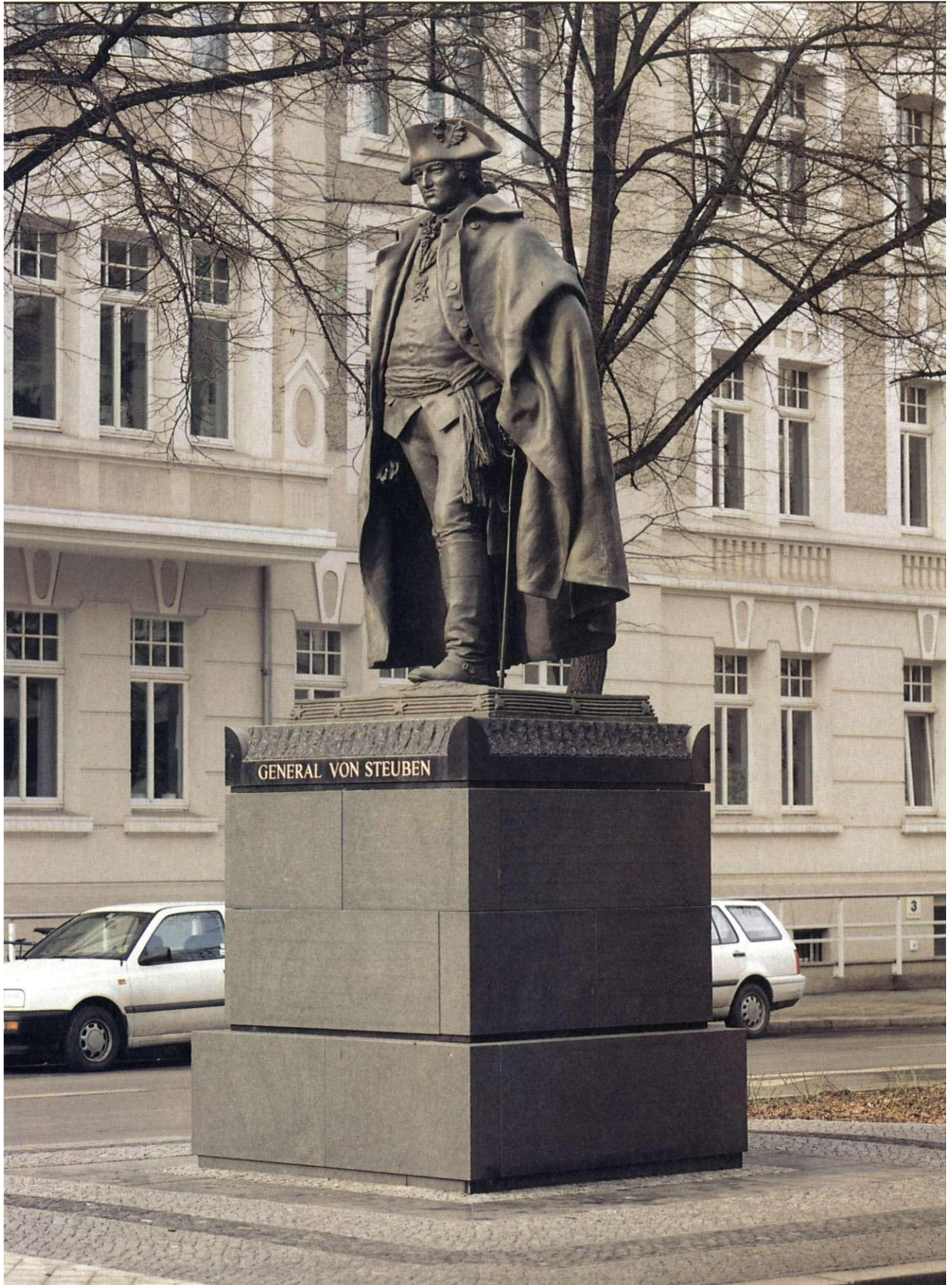
Steubendenkmal in der Harnackstrasse