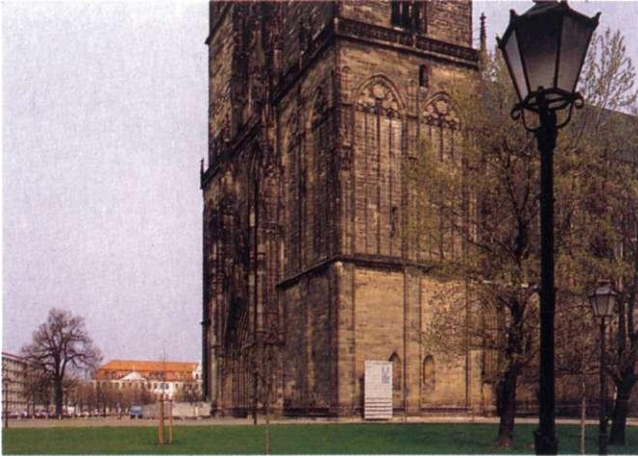
Blick zum Domplatz von der Danzstrasse 1998