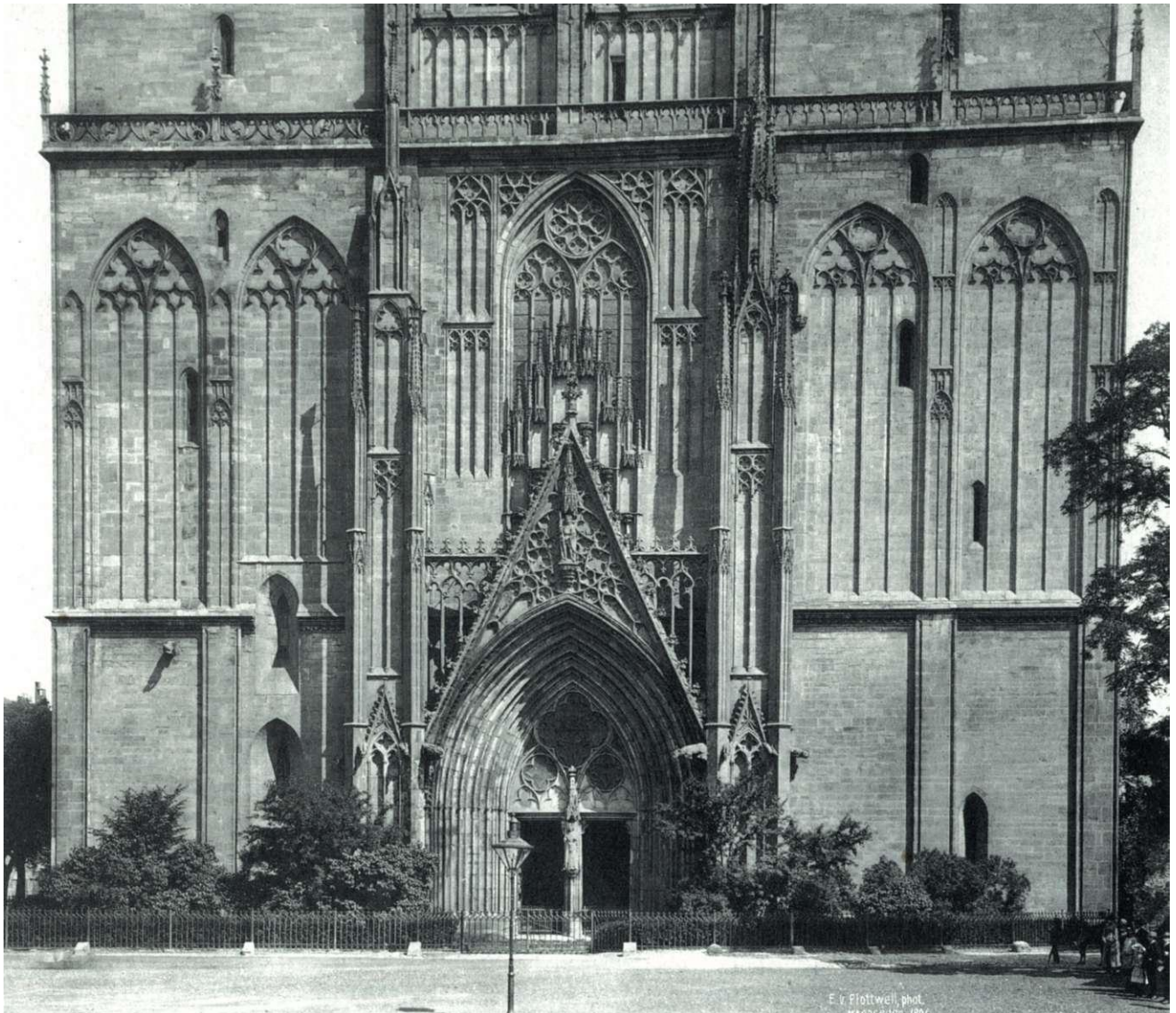
E. v. Flottwell, phot. MAGAZIN 1891