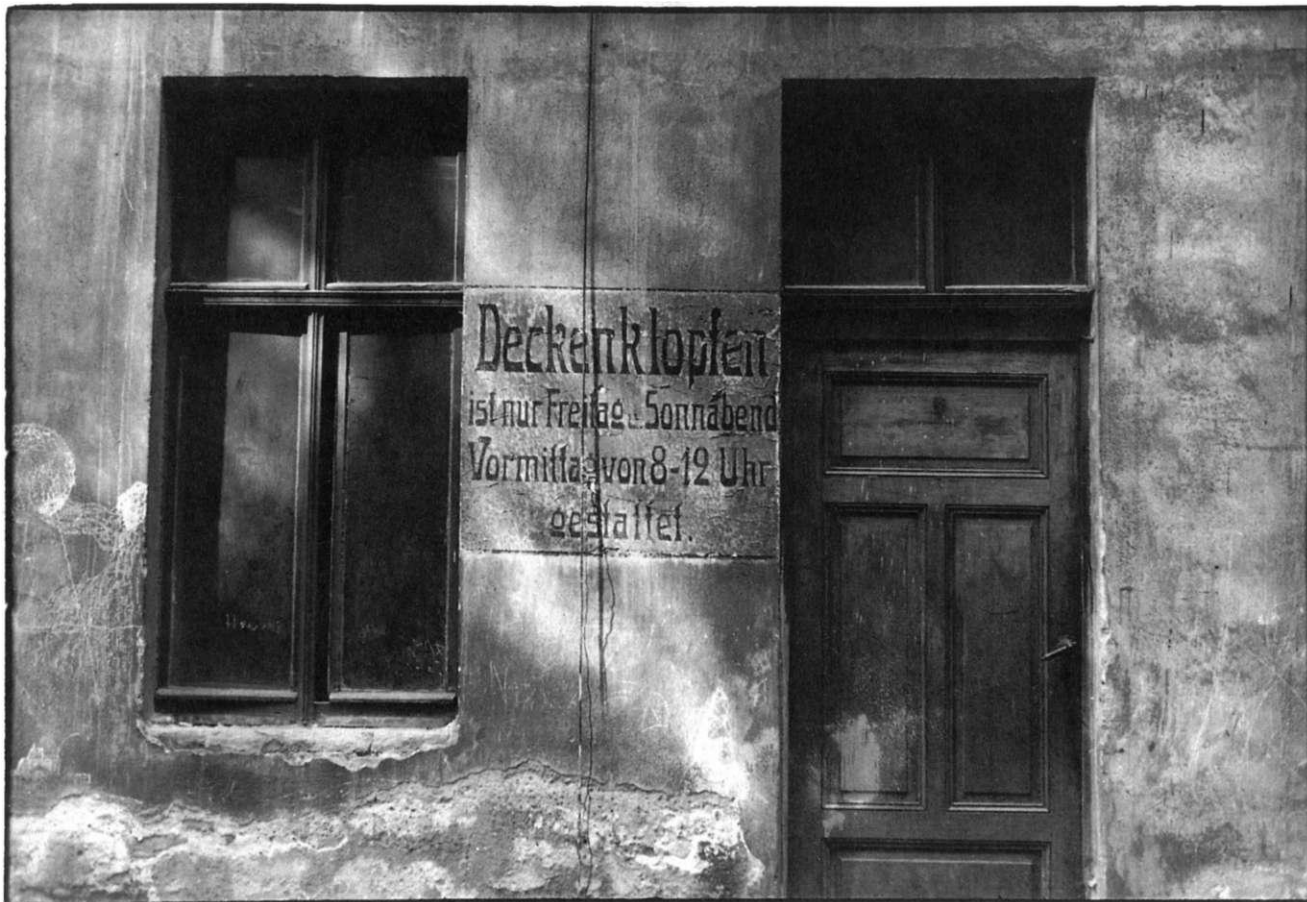
„Hofidylle“ vor der Sanierung der Wohnquartiere im Südlichen Stadtzentrum

Beim Gang durch das Südliche Stadtzentrum wächst das Gefühl für den notwendigerweise prozeßhaften Ablauf von Stadtsanierung. Neben den in jüngster Zeit sanierten Fassaden verblassen die in den 80er Jahren instandgesetzten Fassaden immer mehr. Da diese Gebäude ohnehin vielfach nur mit unzureichenden Mitteln oder unvollständig (obere Gebäudeabschlüsse!) saniert wurden, ist absehbar, daß sie die Sanierungsaufgaben des kommenden Jahrzehnts stellen werden. Dann werden aber auch die Ersatzneubauten bzw. die in den Baulücken errichteten Neubauten der späten 80er Jahre zu Sanierungsfällen geworden sein. Da es sich dabei fast ausnahmslos um Plattenbauten handelt, ergibt sich daraus eine besonders anspruchsvolle Aufgabe für Architekten - Sanierung von Plattenbaufassaden im gründerzeitlichen Bestand!