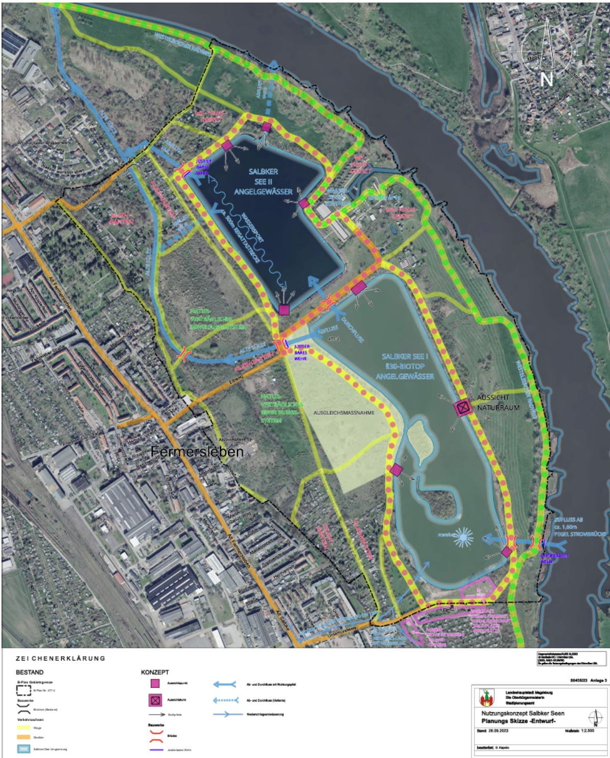
S0435/23 – Anlage: Entwurf Nutzungskonzept Salbker Seen