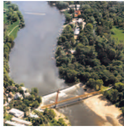
Brücke am Cracauer Wasserfall

Über den Herrenkrugsteg - eine der längsten und zugleich auch schönsten Fußgängerhängebrücken in Deutschland - gelangen Sie in den Herrenkrug . Nun fahren Sie in Richtung Süden entlang des Elberadweges am Elbauenpark 5 . Ihr Weg führt Sie weiter auf dem Ostufer der Alten Elbe bis zur Brücke am Cracauer Wasserfall . Hier können Sie sich entscheiden. Entweder Sie