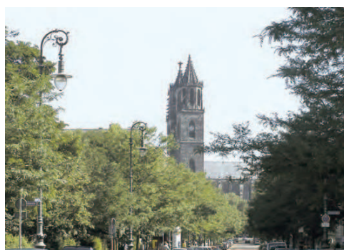
Hegelstraße mit Blickrichtung Dom 1

LANDESHAUPTSTADT MAGDEBURG Stadtplanungsamt