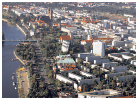
Blick über Magdeburg

Auf nur 27 km Länge erleben Sie die besondere Lage der Stadt am Fluss und erfahren zugleich ihre wechselvolle Geschichte. Wir empfehlen Ihnen eine Tour durch die Innenstadt und angrenzende Stadtteile entlang des länderübergreifenden Elberadweges .