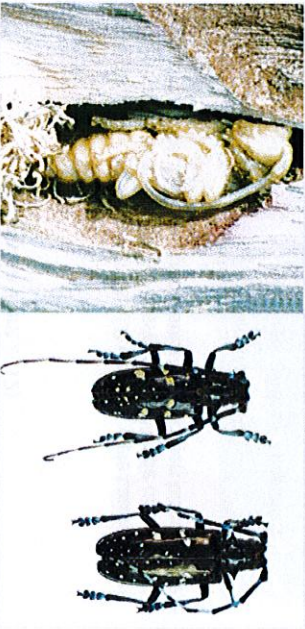
3. Puppe mit grobem Spanpooster in Puppenwiege 4. Erwachsene ALB, links Männchen, rechts Weibchen