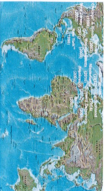
12. Jahr der Erstfunde des ALB unter Freilandbedingungen außerhalb seines Heimatgebietes in Asien (*ganz oder **teilweise ausgerottet)

Heimat: Asien mit China, Korea, Taiwan Eingeschleppt nach: