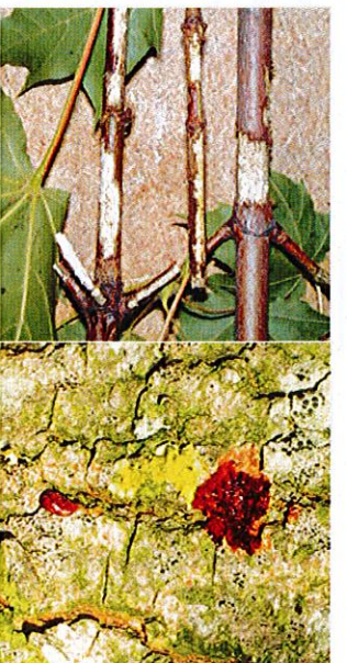
6. Reifungsfaß der Käfer an Ästen

Ausbohrlöcher: charakteristisch kreisrund, Durchmesser 1 - 1,5 cm (11).