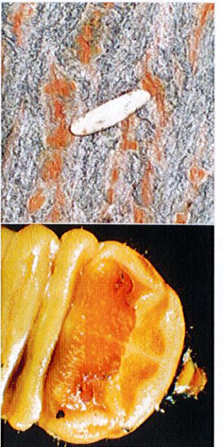
1. Reiskorngroßes Ei (7-8 mm)