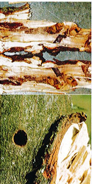
10. Breite Fraßgänge des ALB im Holzkörper