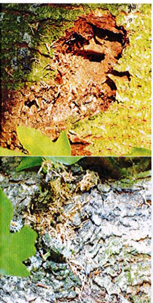
8. Larvenfraß unter der Rinde mit ovalem Einbohrloch der Larve